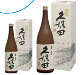
朝日酒造株式会社 Webサイトより