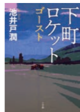
池井戸潤/著、小学館/刊